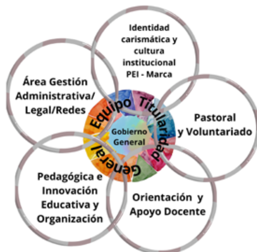
Estructura Organizativa Acompañamiento Formativo

Para garantizar la implementación eficaz y el seguimiento continuo del desarrollo del PEI, se crea el Equipo de Formación General que, colaborando estrechamente con el