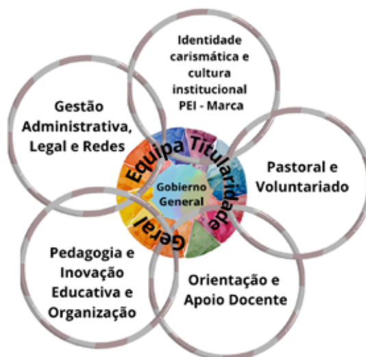
Estrutura Organizativa Acompanhamento Formativo

Para garantir a implementação eficaz e o acompanhamento contínuo do desenvolvimento do PEI, foi criada a Equipa de Formação Geral que, colaborando estreitamente com a